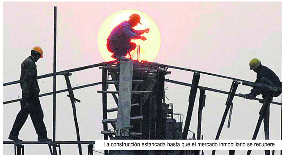
La construcción estancada hasta que el mercado inmobiliario se recupere

La evolución de la economía este año dependerá de los consumidores y de la recuperación del mercado inmobiliario