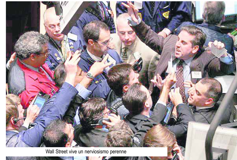
Wall Street vive un nerviosismo perenne

Pero ese no fue el único 'paquete' en el que se metió el gobierno pues terminó comprando 300 mil millones de dólares en valores del Tesoro, además de 1,25 billones